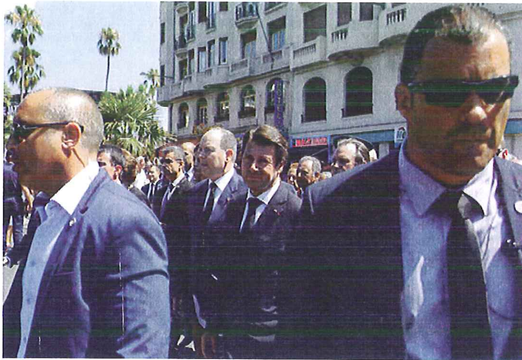
Christian Estrosi à Nice le 18 juillet.