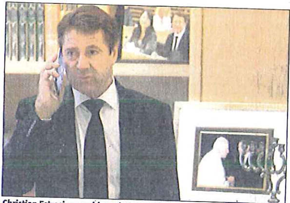
Christian Estrosi a reçu hier soir, un appel du pape François.