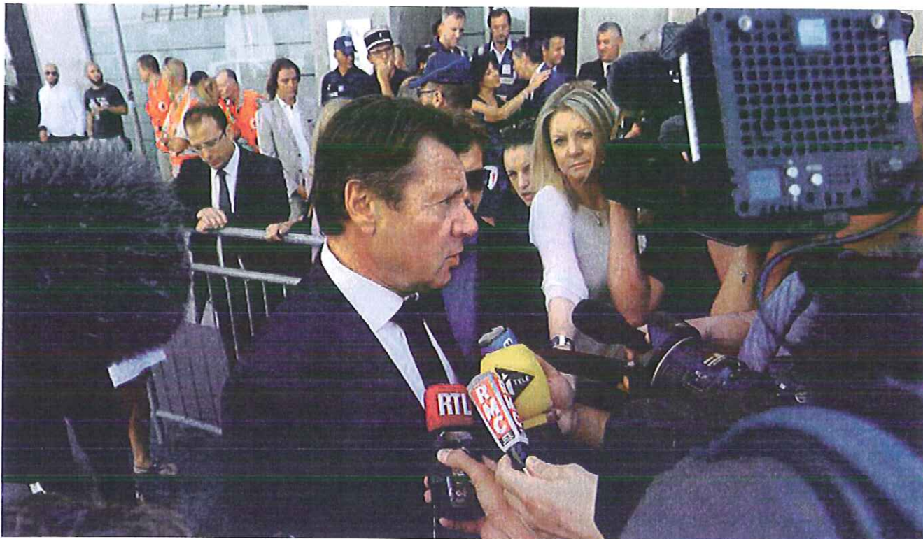
Christian Estrosi, président de la région Paca

LE SCAN POLITIQUE/VIDÉO - Très critique à l'encontre du gouvernement, l'ancien maire de Nice estime que l'exécutif l'a laissé dans un certain désarroi à la suite de l'attentat qui a endeuillé sa ville.